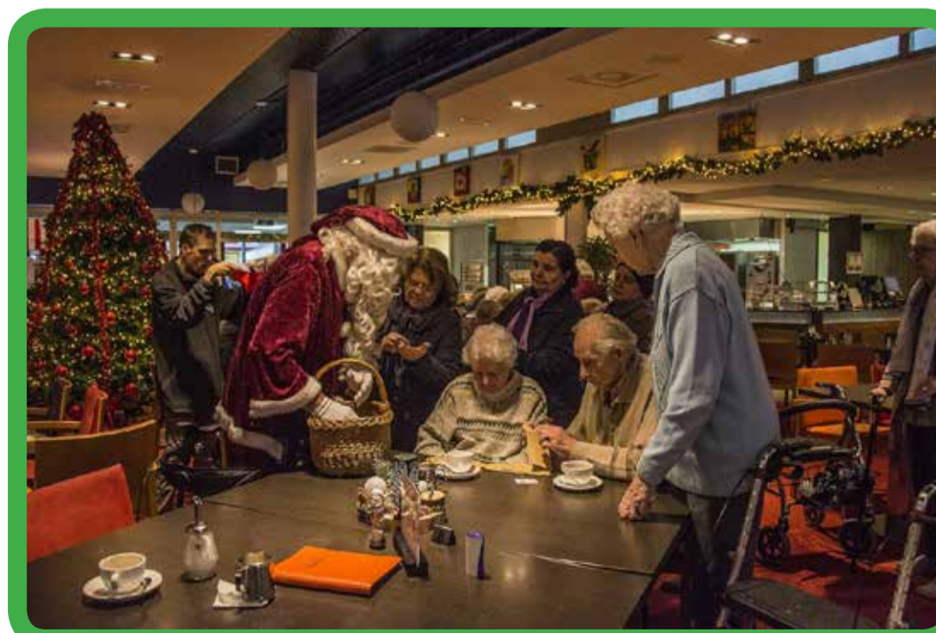
Kerstmarkt de Posten