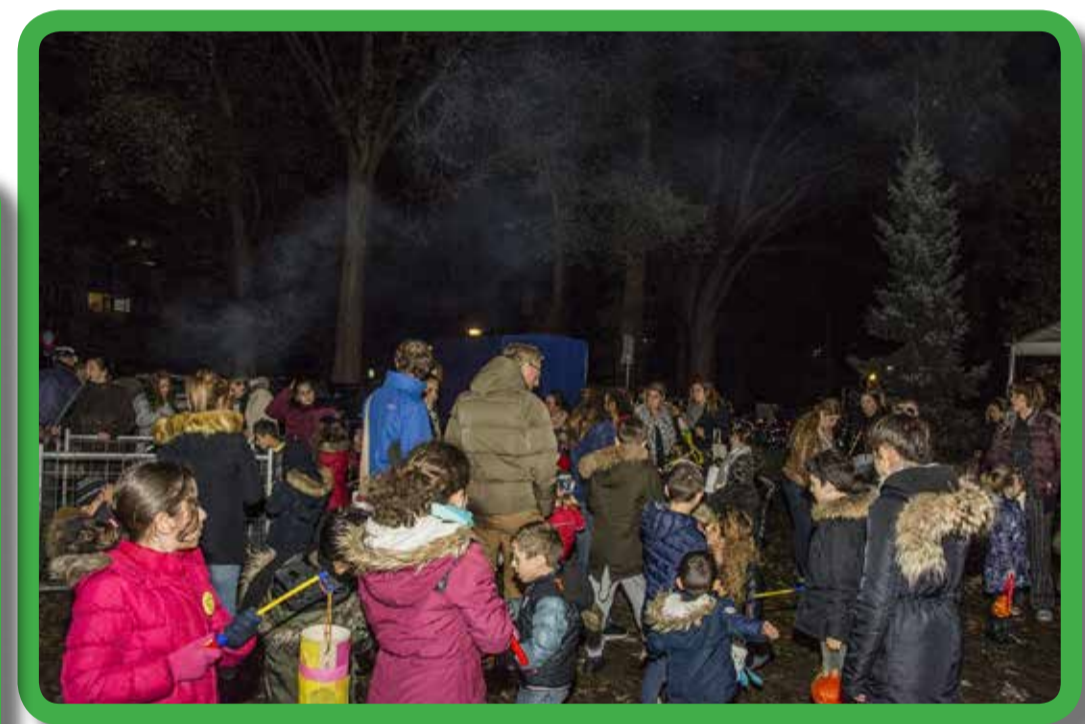
Sint Maarten kinderboerderij