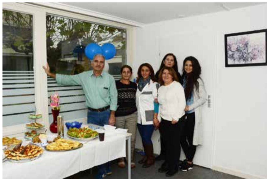
Opening Centrum Samen Sterk

De verschillende bewonerscommissies die actief zijn met activiteiten op hun brink. Bijvoorbeeld de activiteitenvereniging 'De Brink' die jaarlijks 'Multi Culti' organiseert.