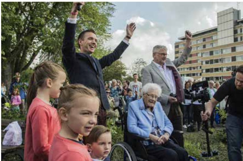
Opening Feest van Verbinding

Naast de problemen die de Wesselerbrink kent, zijn er ook veel mooie initiatieven die door bewoners worden opgezet. Wat er het afgelopen jaar uitsprong voor mij was, het 'Feest van verbinding'. En voor mij zat dat vooral in de voorbereiding. Zoveel bewoners uit de wijk, die bereid waren om mee te denken, initiatieven te ontwikkelen en deze ook nog eens zelf uit te voeren. Zo werd er door bewoners 'Tent van verhalen' bedacht. Een plek in de wijk waar mensen hun verhaal konden doen. Als mensen een 'podium' krijgen en anderen willen luisteren, dan zijn ze meer dan bereid om hun verhaal te doen, zo bleek die dag tijdens het 'Feest van verbinding'. Ook het 'Foodplaza' op 'de Bult' was een succes: eten verbindt!