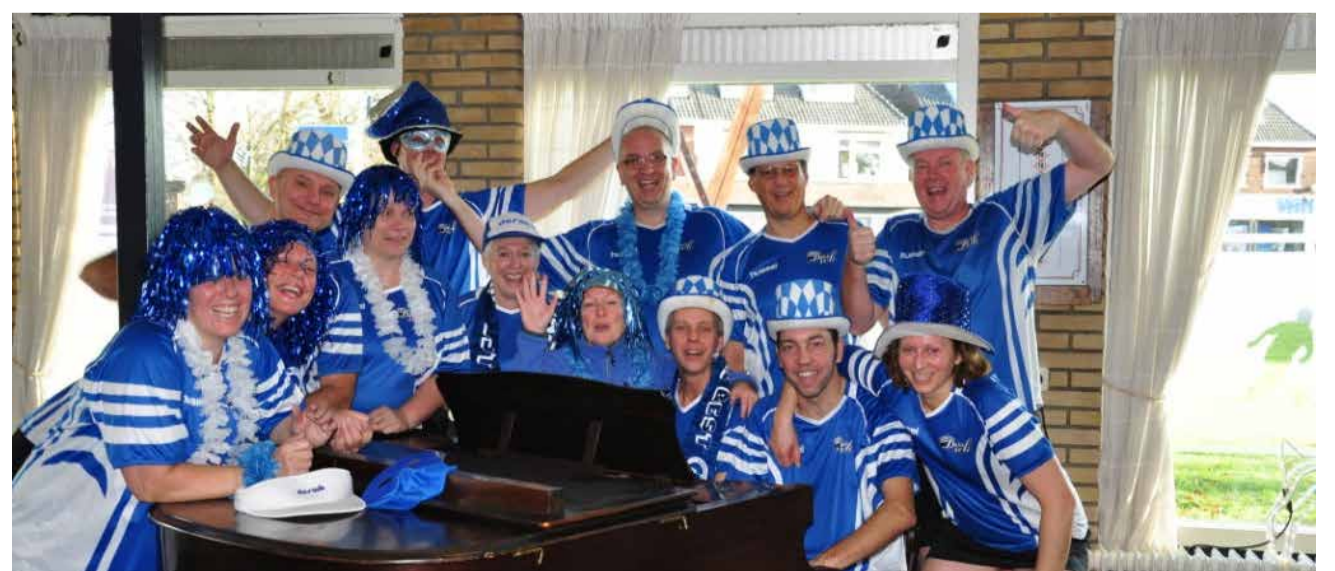
DOS-WK Korfbalclub

U kunt een extra restafval- en gft-container aanvragen. De kosten hiervoor bedragen €35,00 per container. U hoeft niet thuis te zijn voor de afspraak; achteraf ontvangt u thuis een factuur.