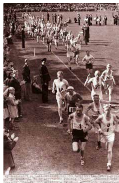
Start van de eerste marathon in Enschede in 1947