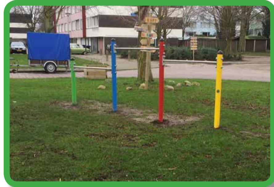
Nieuw duikelrek tubbergenbrink