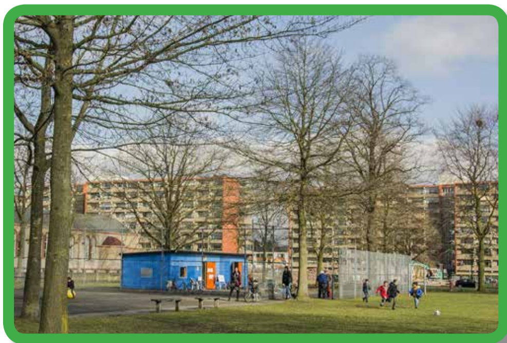
Samenwerking Smiley & de Brink