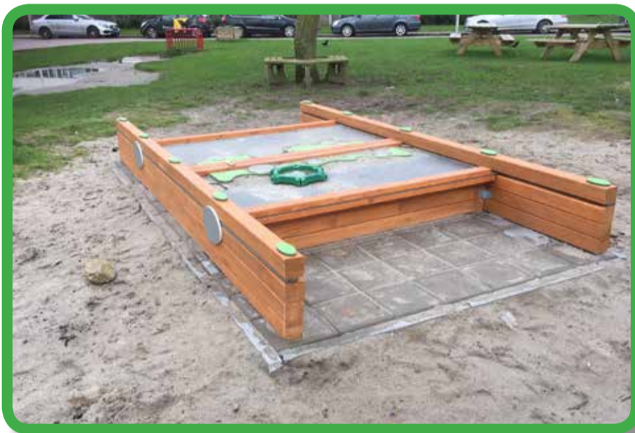
Nieuwe zandbak tubbergenbrink