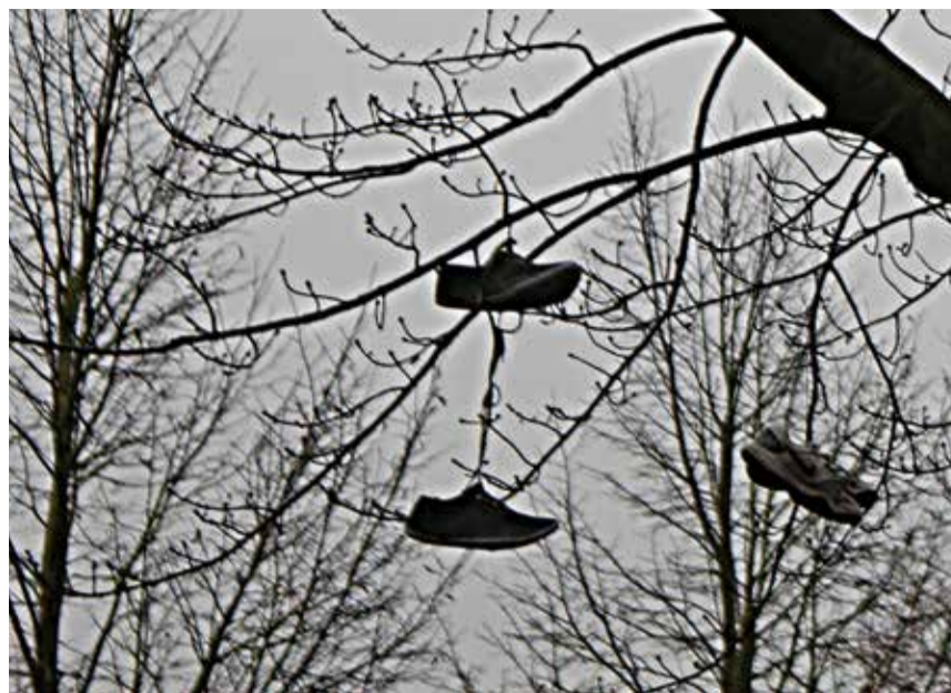
Antwoord vorige Ken Je Wijk: Gestutte flat aan Het Leunenberg

Het antwoord vind je in de volgende Brinkpraat.