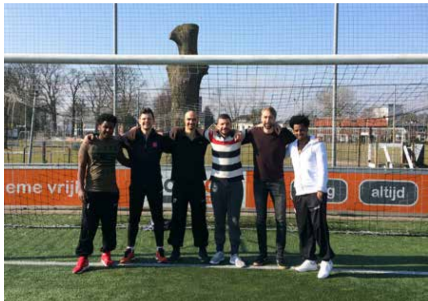
Beweegprogramma Life Goals voor statushouders van start