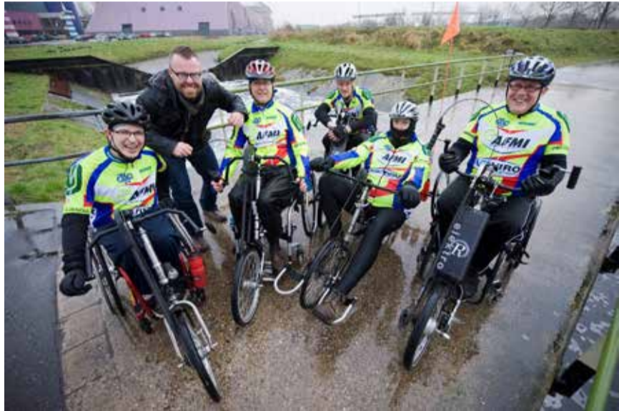
De deelnemers van Handbikegroep Twente

Van 20 t/m 22 maart zorgden de mensen van de Handbikegroep Twente met hun sponsortocht van Enschede naar Otterlo en vice versa ervoor dat de Stichting Haarwensen 2 kinderen weer van een echte haardos kunnen voorzien.