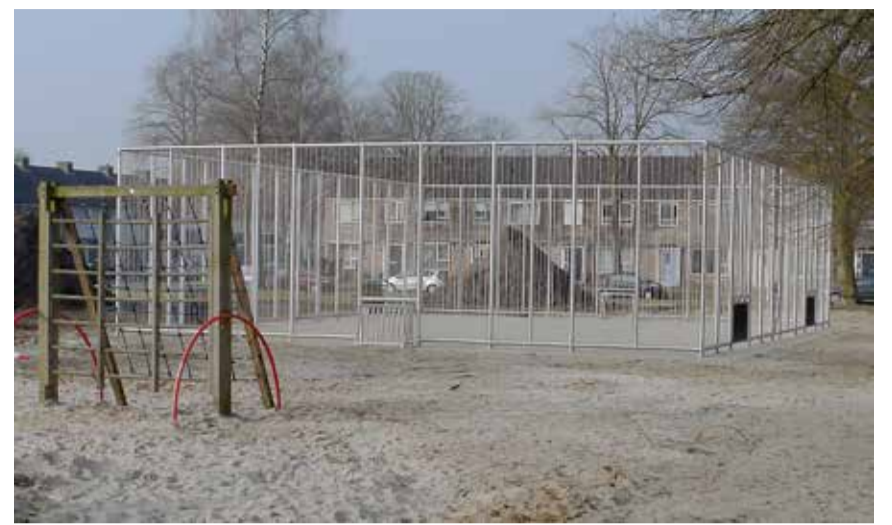
De nieuwe pannakooi op het voormalig schoolterrein het Oosterveld.