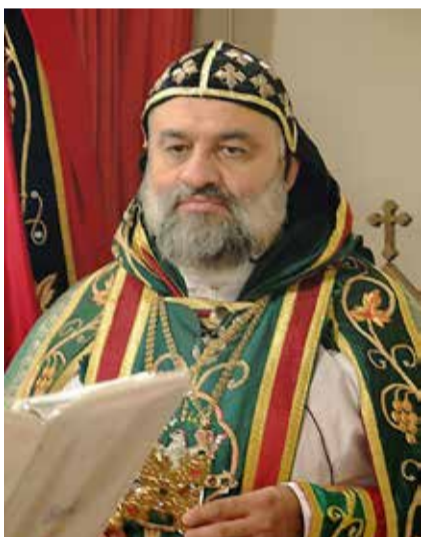
Patriarch Mor Ignatius Aphrem Karim II