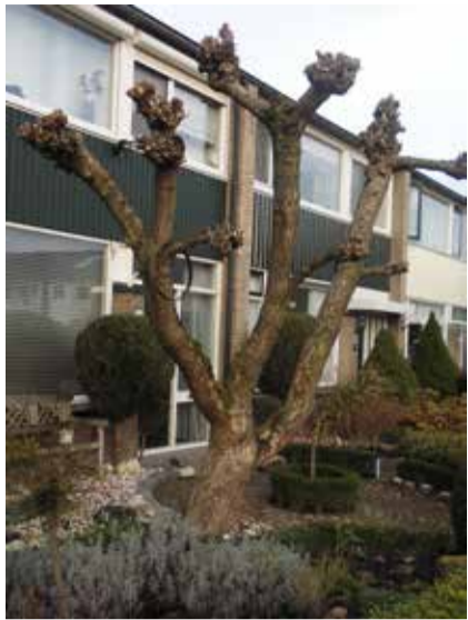
Antwoord vorige Ken je wijk: Tuin aan de Mallumbrink

Een foto genomen in de Wesselerbrink, weet jij wat en waar het is??? Het antwoord vind je in de volgende Brinkpraat.