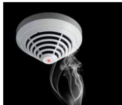
Een rookmelder cadeau bij de gratis woningcheck

ders uit en gaf de aanwezigen de mogelijkheid om zich te melden voor een gratis woningcheck, met als presentje bij zo'n check een brandmelder.