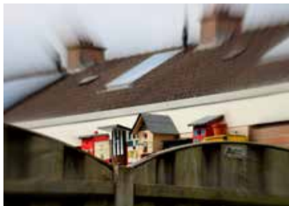
Antwoord vorige Ken je wijk: Vogelhuisjes in Het Oosterveld-Markveldebrink.

Een foto genomen in de Wesselerbrink, weet jij wat en waar het is??? Het antwoord vind je in de volgende Brinkpraat.