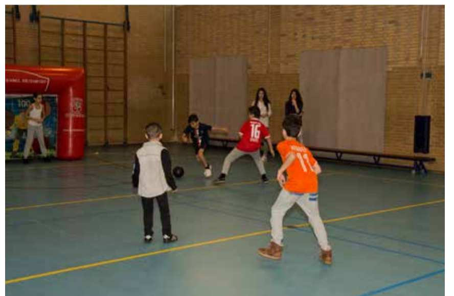
Zaalvoetbal De Posten.

laten de dames zelfgemaakte houten vogelhuisjes en decoraties zien. Hun website: www.