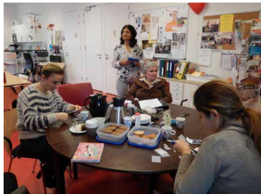
Gezellig bezig zijn bij de buurthuiskamer

Telefoon 053 477 5219 KRP nr.: 10402 Provoet nr. 306869