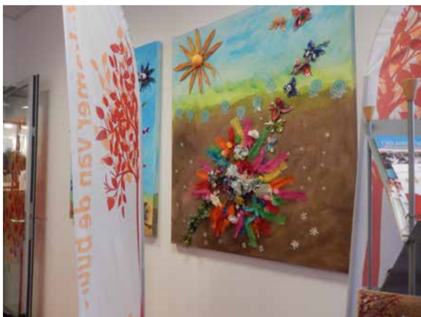
Een van de gezamenlijke knutselprojecten