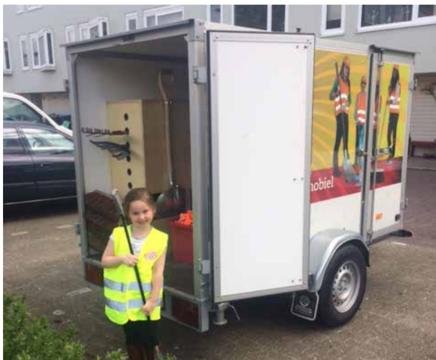
Een goed voorbeeld doet goed volgen!

Bewoners en kinderen van de Bentelobrink hebben begin april van het mooie weer gebruik gemaakt en zijn aan de slag gegaan met hun woonomgeving. Er is een stukje ingezaaid met wilde bloemenzaad, en zwerfvuil geraapt.