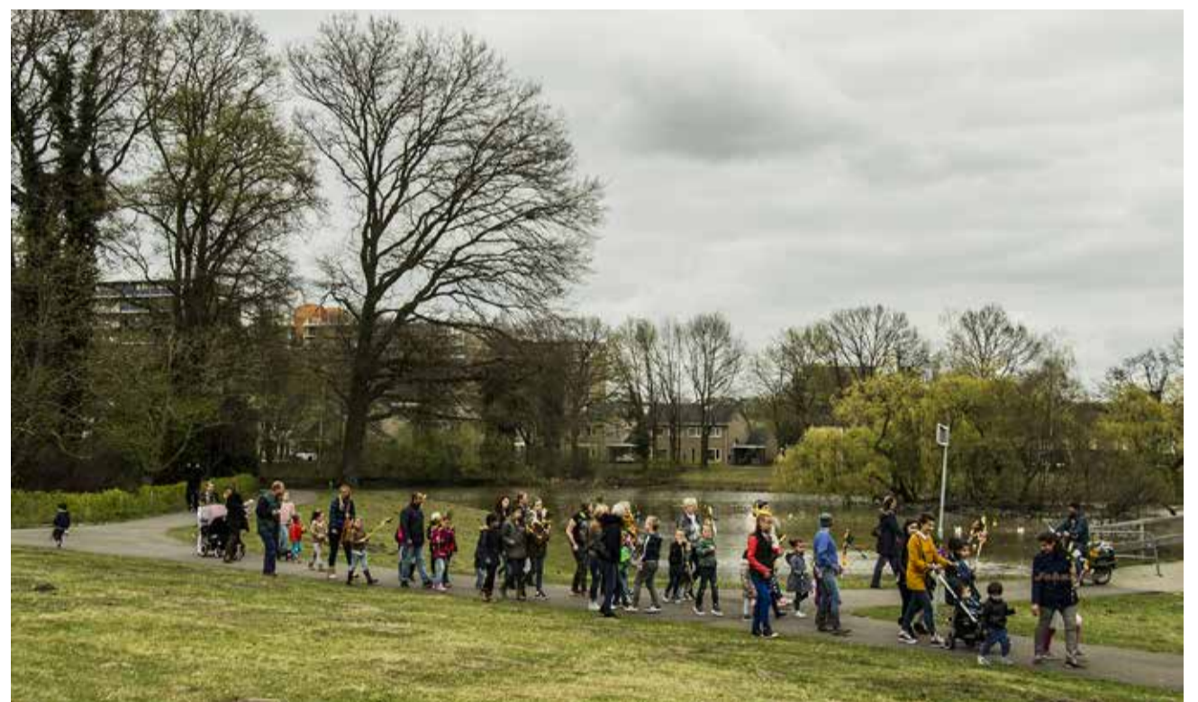
Fotoimpressie van de palmpasenoetocht 5 april 2017, bij Kinderboerderij de Wesseler. Het was weer een geslaagde opkomst!