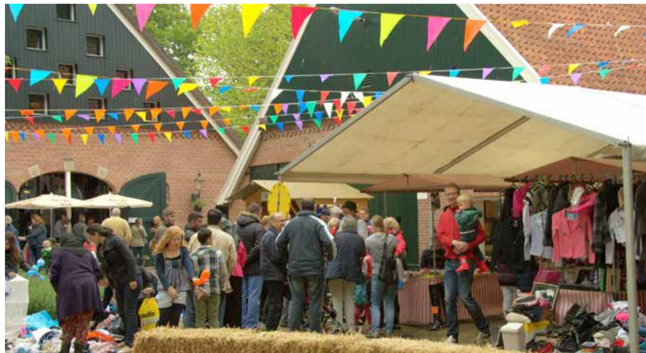
Festiviteiten bij Kinderboerderij de Wesseler

Hebt u zelf ideeën of wilt u vrijwilliger worden op het Feest van Verbinding? Stuur dan een mail met uw naam en telefoonnummer naar: mail@tafelvanmarcelis.nl .