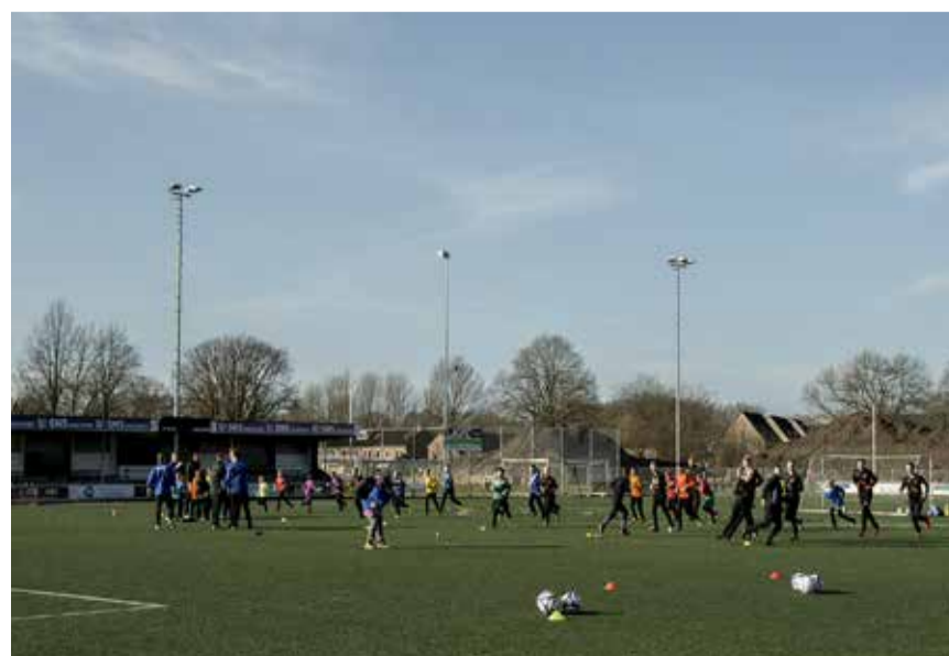
Fanatieke keepers hard aan het trainen

Bent u benieuwd geworden? Kijk op onze website www.55plus-enschede.nl of kom langs in ons centrum 't Pluspunt, Schuttersveld 17 te Enschede. Bellen kan ook: tel. 053-4322081.