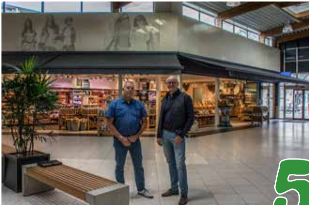
Heropening Winkelcentrum Enschede Zuid pag 5