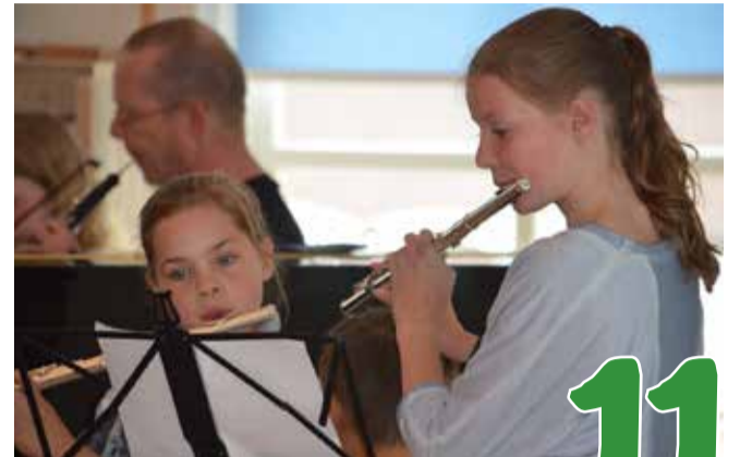
Zaterdag 28 september Burendag pagina 11