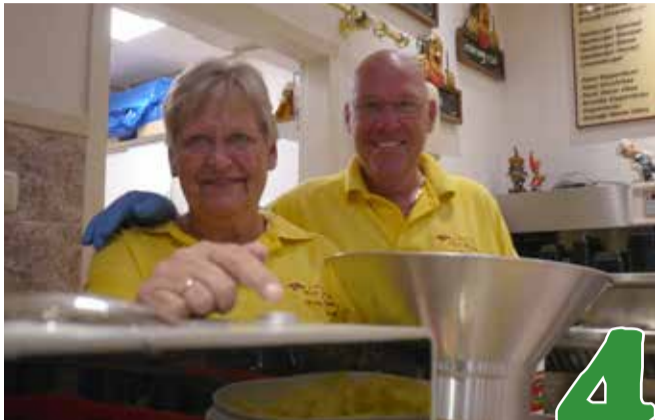
Verse patat in Winkelcentrum Bijvank pagina 4

Jaargang 46 • nummer 172 • September 2019