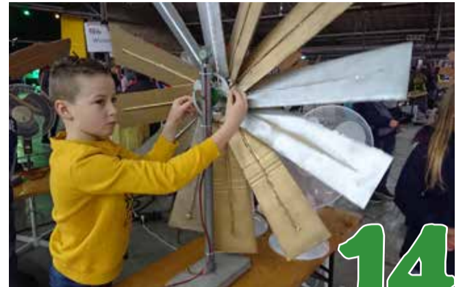
Alles-in-één-school De Zuidsprong