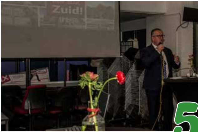
Nieuwjaarsreceptie op de Magneet