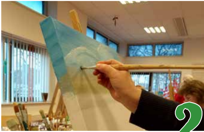
Schilderclub in Huiskamer van de Buurt