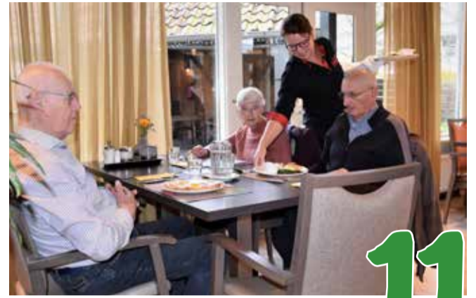
Nieuw: het menu van restaurant De Brink