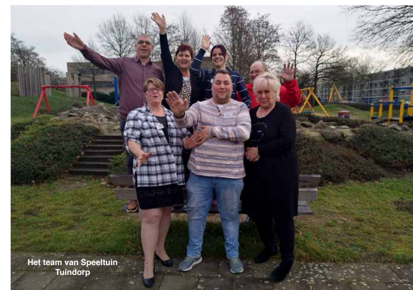
Het team van Speeltuin Tuindorp