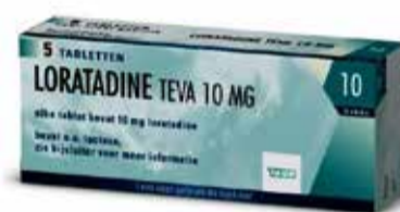
Loratadine 5 stuks, €1,98

Wesseler-nering 1B, 7544 JA Enschede, Drs. H.M. Slot-van Smeden, apotheker, Geopend van maandag t/m vrijdag 8.00-18.00 uur, Tel. 053-4770025, apotheekbroekheurne@ezorg.nl, www.apotheekbroekheurne.nl