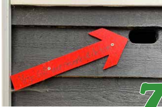
Erve Leppink viert 5-jarig bestaan