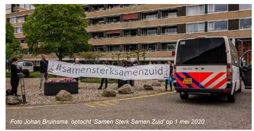
optocht 'Samen Sterk Samen Zuid' op 1 mei 2020

dePosten Hartelijk Huiselijk Hulpvaardig