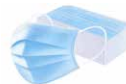
Mondkapjes voor 1-malig gebruik 5 stuks voor €5,95

Vanaf 8 juni vindt u ons op tijdelijk op een andere locatie. Onze inrichting is hard toe aan een opknappbeurt. Begin augustus verhuizen wij weer terug. U kunt ons vinden aan de Wesseler Nering 38, tussen Kapsalon Ineke en Vishandel Je Maatje in.