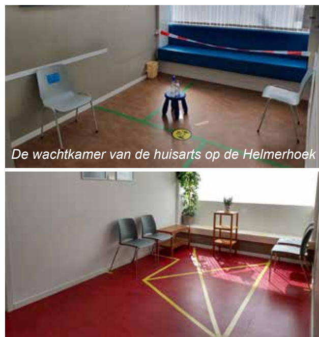
De wachtkamer van de huisarts op de Helmerhoek

Nee, dat is niet mogelijk. In Nederland mag ook geen verklaring van u geeist worden.