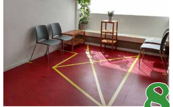
Naar de huisarts in coronatijd, veelgestelde vragen