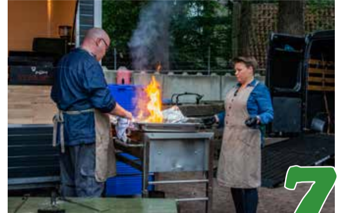
Ondernemers in Coronatijd, Ray's Cooking