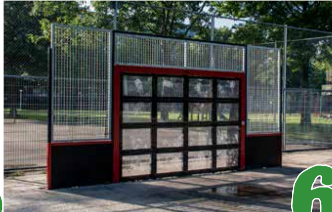
Er is nu ook een voetbalmuur in Zuid