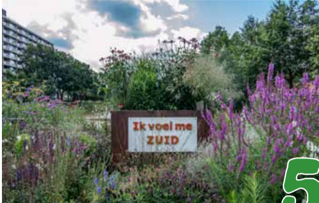
Verslag van de digitale Stadsdeelvergadering

Jaargang 47 • nummer 182 • September 2020