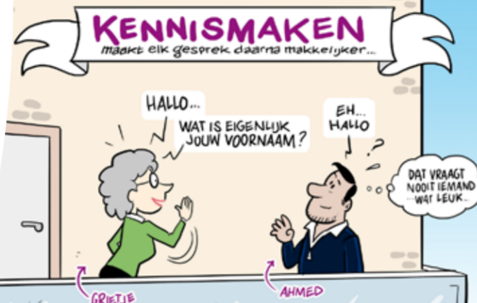
Hoe zien bewoners het thema kennismaken? Cartoonist Gert Jan Kleijne verbeeldde dit in een mooie cartoon