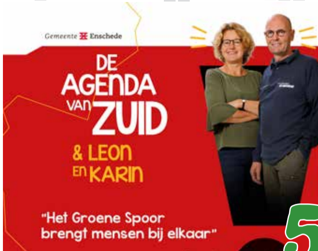
Het Groene Spoor brengt mensen bij elkaar

Jaargang 47 • nummer 184 • November 2020