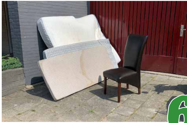
Afval hoort in de ton, niet in de gang