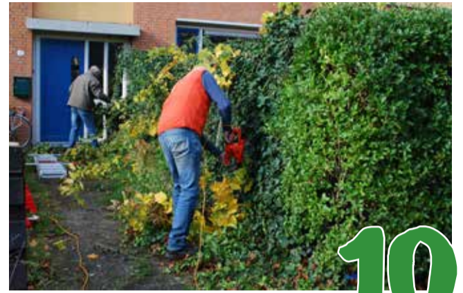
Stichting Present: "Ik wil wat terug doen"