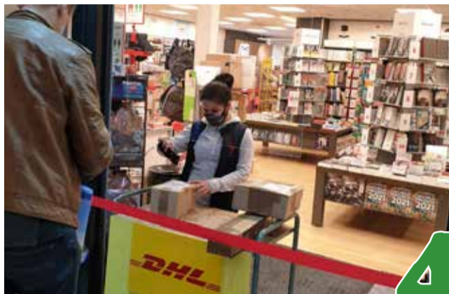
Winkelcentrum Enschede Zuid in coronatijd