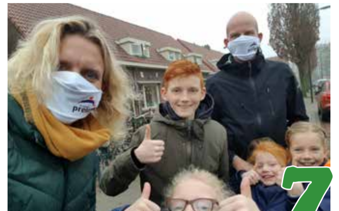
Kerst vierden we toch een beetje samen