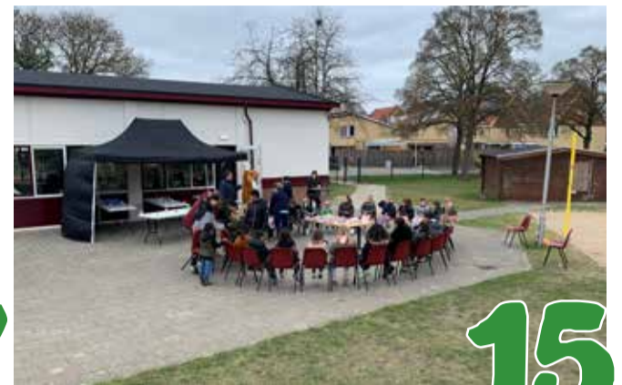
Er mogen weer dingen op Speeltuin Tuindorp