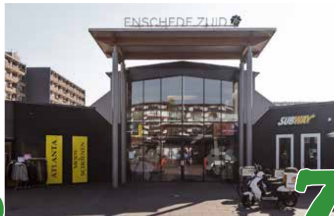
Winkelplezier in Enschede Zuid