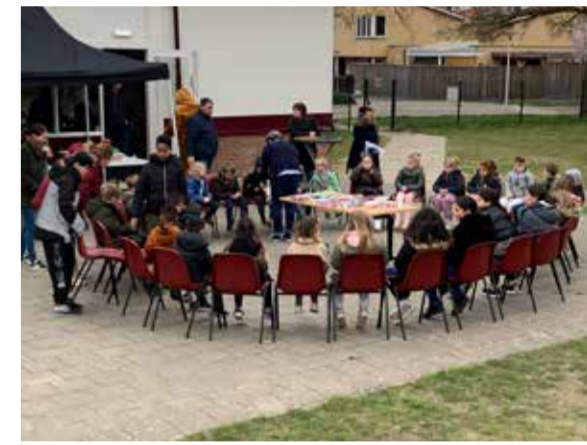
Vlierstraat 65 7544 GG Enschede Tel: 053-4762523 @: sp.tuindorp@gmail.com