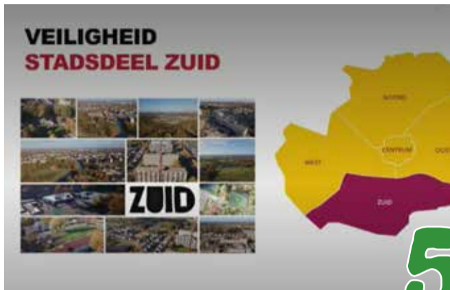
Verslag Stadsdeelcommissie Zuid vergadering